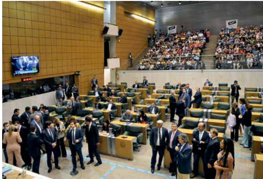
Entidades do funcionalismo acompanham votação do reajuste

O tratamento diferenciado adotado pelo governo do Estado não encontra amparo legal, pois fere o princípio da isonomia e caracteriza ato discriminatório.