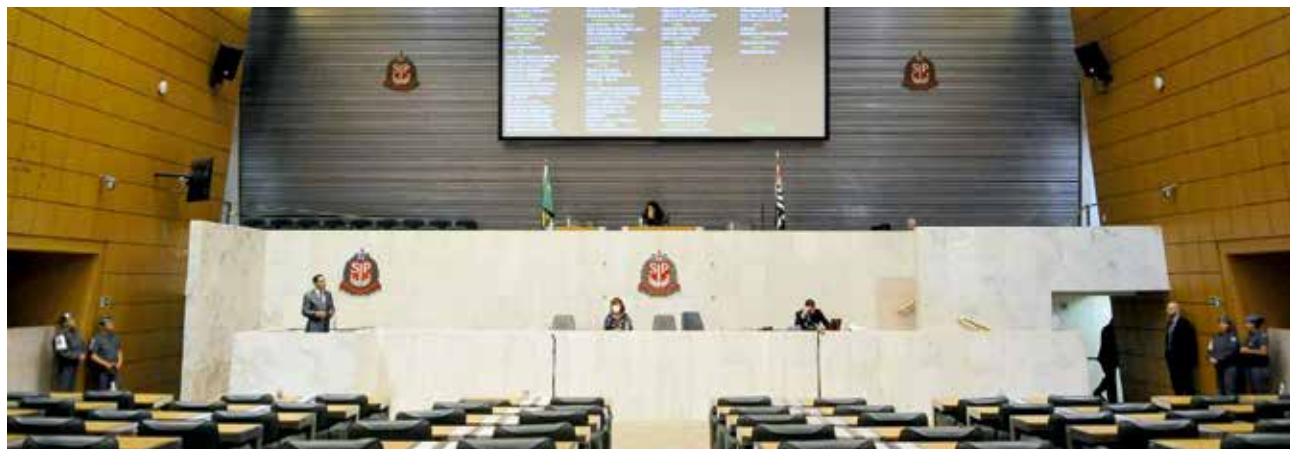
Plenário Juscelino Kubitschek, palco da homenagem aos 75 anos da AFALESP; evento também marca os aniversários da ASPAL e da COOPERALESP

A sessão solene, que terá transmissão ao vivo pela TV Alesp (na televisão e nas redes sociais da Casa), também homenageará os aniversários da ASPAL (Associação