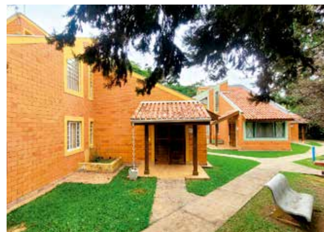
Colônia de Caraguá conta com piscina, campo de futebol, churrasqueira e playground (foto principal e foto menor à esquerda); segunda colônia fica em Socorro, no Circuito das Águas (foto menor à direita)