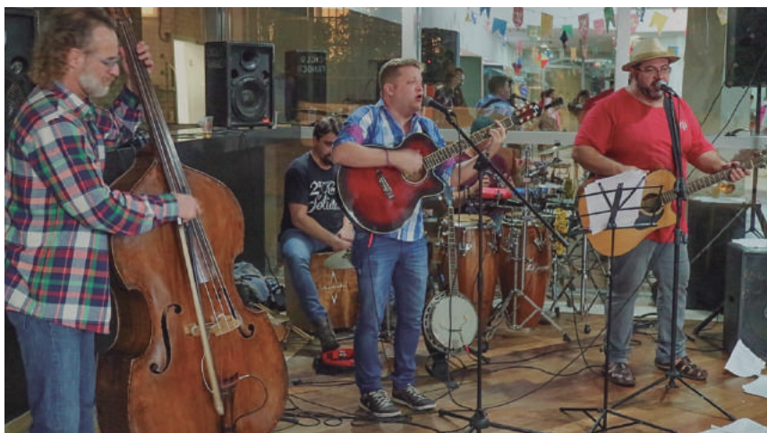
Banda Roça'n Roll anima festa junina