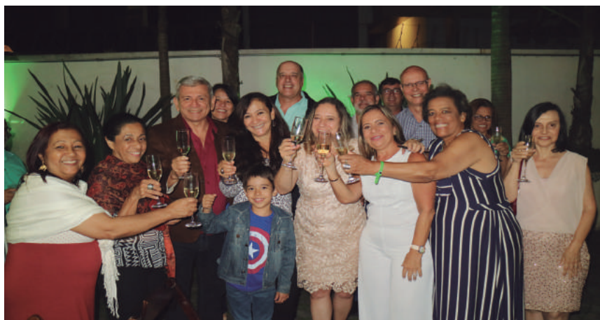
Festa de Encerramento de 2017 e Boas Vindas a 2018

nossa associação. Confira abaixo algumas fotos de momentos que marcaram o encerramento do ano de 2017, em 13/12/2017, e das festas do Dia das Mães, em 17/5 e da Festa Junina, em 22/6. Mais fotos podem ser vistas no site www.afalessp.com.br , ícone eventos.