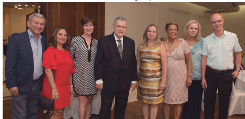
Deputado (ao centro) agradece homenagem recebida

Uma solenidade, em 13/4, na Casa de Portugal, homenageou o deputado federal Arnaldo Faria de Sá por seu trabalho em prol do serviço público. O deputado tem sido um árduo combatente à reforma da Previdência Social. Desde 2017, Arnaldo reuniu diversas entidades, dentre elas a Afalesp, para discutir ações para impedir a votação da PEC 287.