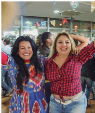
Associada à caráter na festança

No dia 22 de junho, a Afalesp realizou seu tradicional Arraial. Teve pipoca, paçoca, pé de moleque, canjica, cachorro quente, pamonha, curau, bolo de milho, arroz doce, pinhão, vinho quente, churrasco, quentão e muito mais!