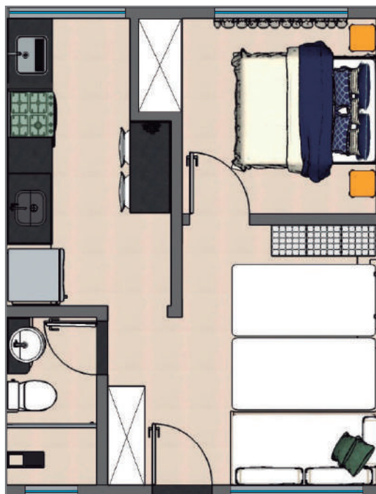
Planta do apartamento