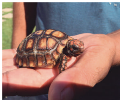
Nina nasceu há um ano