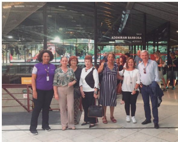
e no Centro Cultural onde assistiu ao documentário sobre Adoniran Barbosa