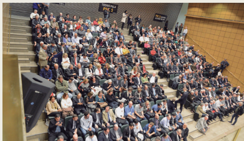
Público lotou Plenário JK no dia da votação da PEC