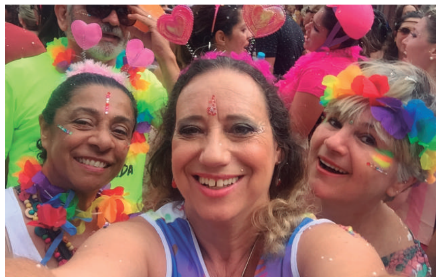
Foliões da Afaesp no Carnaval deste ano