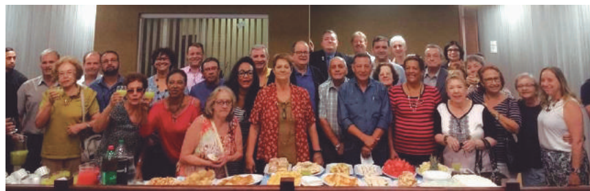
Associados da Aspal comemoram aniversário da entidade

São 14 anos desde a criação da Associação dos servidores aposentados da Assembleia Legislativa do Estado de São Paulo (Aspal), completados em abril de 2018, e comemorados no dia 5, com um ato solene, realizado com a presença de representantes de diversas entidades de defesa do funcionalismo, como a