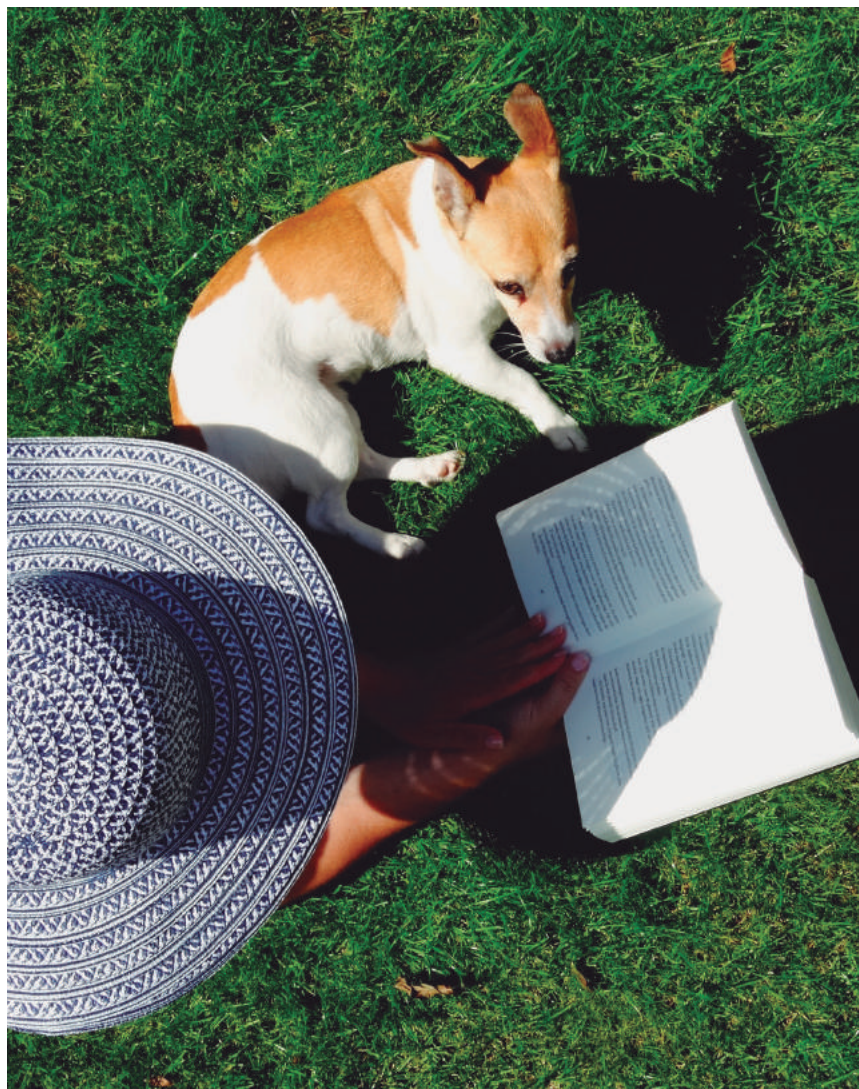
Um dos primeiros hóspedes de quatro patas já se sente em casa

No ato da inscrição, o usuário da colônia deverá preencher formulário de responsabilidade (sem o qual não será permitida a entrada do animal).