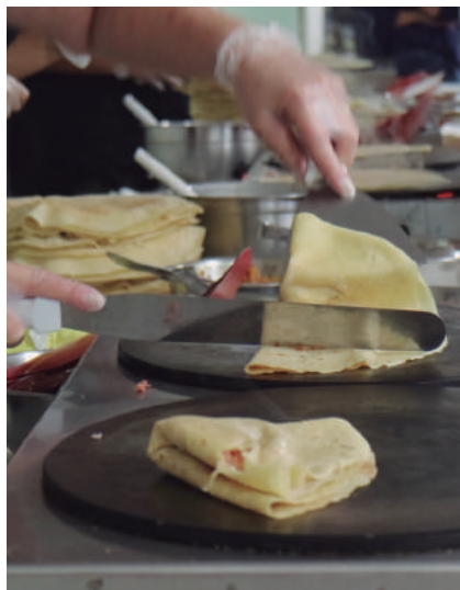
Comida sempre deliciosa