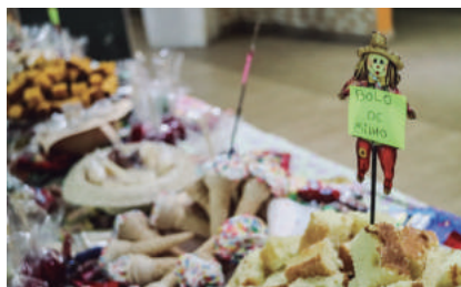
Deliciosas comidas juninas