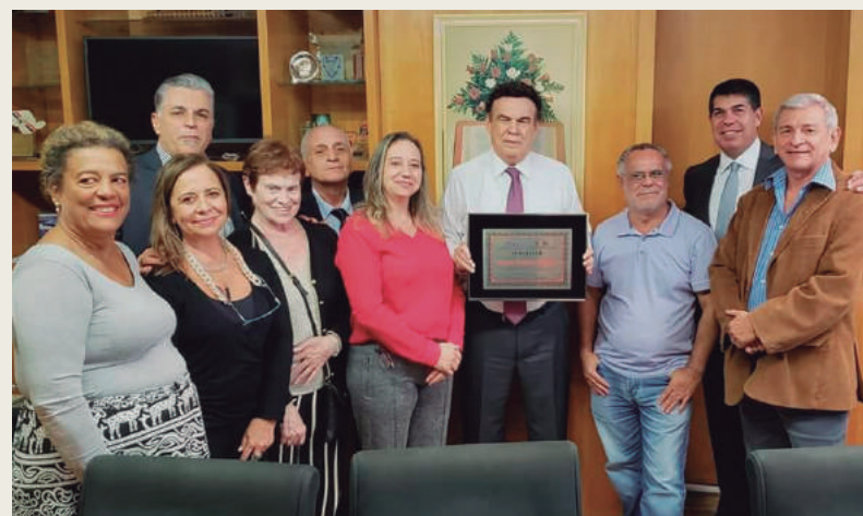
Afaesp e Aspal homenageiam mandato do deputado Campos Machado.

de com outros estados da Federação, que já haviam adotado a medida e com isso deixa de perder seus servidores mais qualificados para outros estados em busca de salários melhores. Isso vinha afetando fortemente a qualidade de serviços públicos prestados em São Paulo. A Afaesp fez parte dessa luta pela aprovação da PEC 5, juntamente com outras entidades que representam as carreiras contempladas e parabeniza aqui o deputado Campos Machado pelo empenho em ver a matéria acolhida e também agradece aos deputados que votaram favoravelmente a esse pleito.