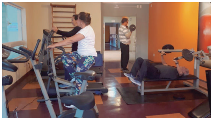
Associados usam esteiras ergométricas e equipamentos

A academia da Colônia de Férias de Socorro recebeu duas esteiras ergométricas e alguns equipamentos para muscula-