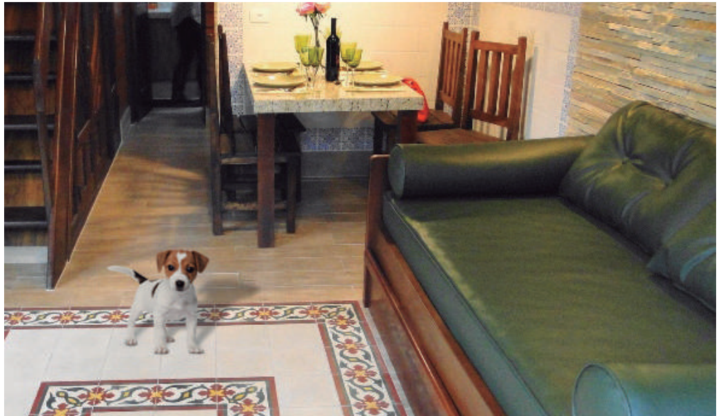
Em Caraguá, uma unidade está preparada para receber pets e em Socorro, duas

Muitos associados há tempos reclamavam permissão para irem às colônias de férias acompanhados de seus bichinhos de estimação. Finalmente, depois de a diretoria estudar essa possibilidade e a conveniência de adotar essa medida, foi criado o Espaço Pet nas colônias de Caraguatatuba e de Socorro. A ideia parece ter agradado aos associados, que agora podem desfrutar de seus momentos de lazer com seus melhores amigos. Pág. 3