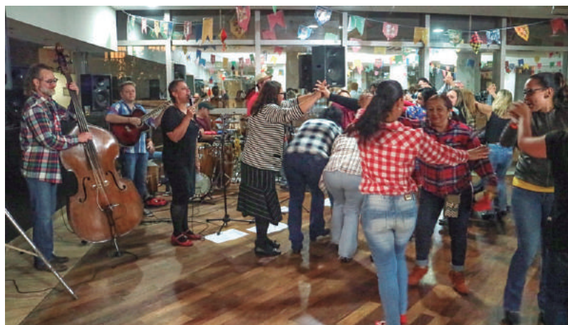
Alegria na quadrilha da festa junina