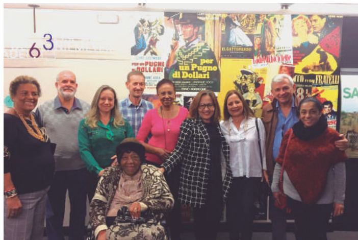
Grupo no cine Belas Artes

dido. Tem sido cada vez melhor e atraído cada vez mais associados. Você é nosso convidado na próxima Tarde no cinema! Fique atento aos nossos e-mails e visite também nosso site para saber da programação.