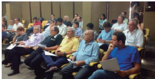
Assembleia de servidores debate pauta de reivindicações

A Lei 1325/2018, que trata do reajuste salarial de 2,84%, a partir de primeiro de março, aos servidores da Assembleia Legislativa do Estado de São Paulo, foi publicada no Diário Oficial de 13/6/2018. O reajuste, que corresponde ao índice da inflação registrada no período foi fruto da Campanha Salarial levada a efeito pelas entidades que representam os servidores