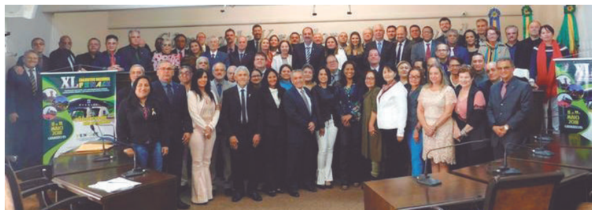
Diretores da federação posam para fotografia

De 8 a 11 de maio, a Afaesp, a Aspal e o Sindap participaram em Gramado do XL Encontro Nacional da Federação Nacional dos Servidores dos Poderes Legislativos Federal, Estaduais e do Distrito Federal (Fenale). O encontro recebeu o maior número de participantes até então registrado e foi um grande sucesso. Debateu o tema “O legislativo que nós queremos!” e, ao final, aprovou a Carta de Gramado, com os principais itens concluídos durante o evento, a ser encaminhada ao Congresso Nacional.