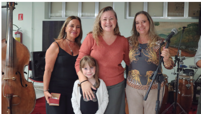
Mãe é homenageada durante a festa