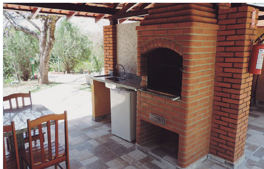
Churrasqueiras em Socorro. Ao todo, seis unidades