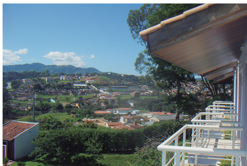
Vista privilegiada, em Socorro