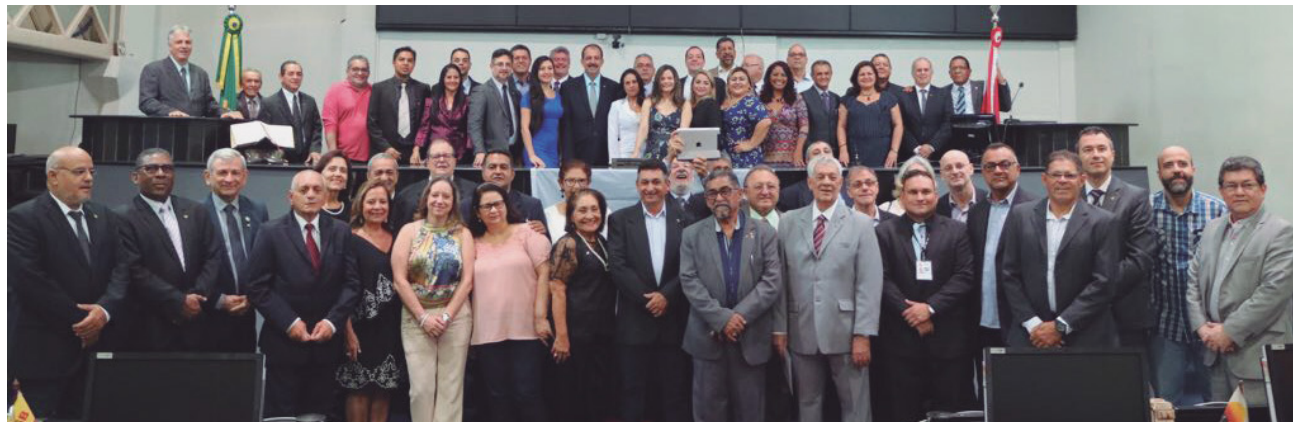
Grupo reunido em Belém

A Fenale realizou seu XXXIX Encontro Nacional, em Belém do Pará, de 14 a 16 de novembro, cujo tema central foi a Negociação Coletiva no Serviço Público.