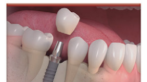
Implantes e implantes zigomáticos

AGENDE A SUA CONSULTA PARA CUIDAR DO SEU SORRISO COM QUEM TEM MAIS DE 37 ANOS DE EXPERIÊNCIA.