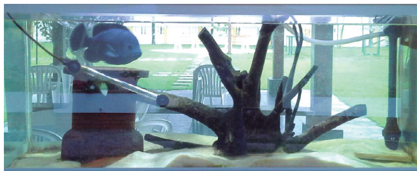
Novo aquário, em Caraguá

alegria das crianças. Em Socorro, foi realizada a poda das árvores da calçada, que dependia de autorização da Prefeitura local, os funcionários passaram por treinamento de Brigada de Incêndio e já temos em mãos o laudo do Corpo de Bombeiros que torna a colônia apta para enfrentar situações de emergência. A colônia agora conta com local de compostagem para reciclar material orgânico: especialmente grama e folhas retiradas na limpeza local.