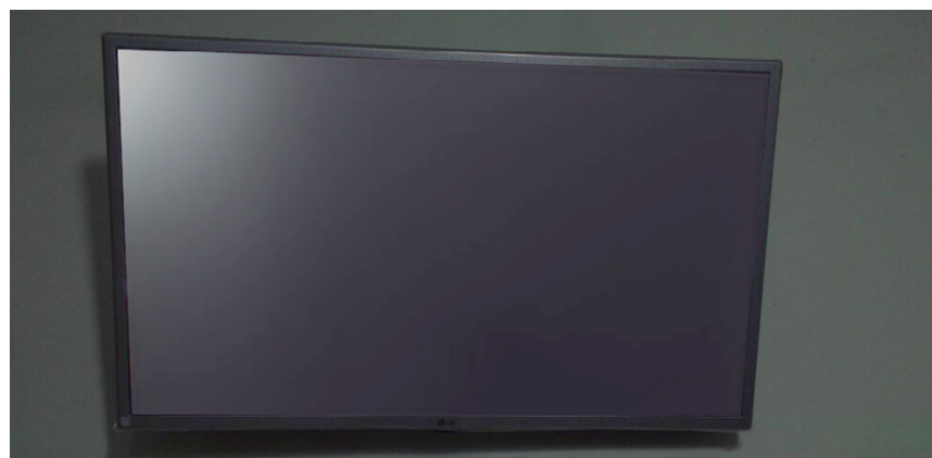
Unidades de Caraguá agora com novas TVs de LCD