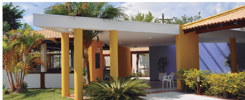
Sede de Caraguá, sempre linda