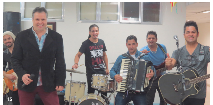
8, 9, 10, 11 e 12 Chá Anual dos Aposentados - 13, 14 e 15 Festa Junina