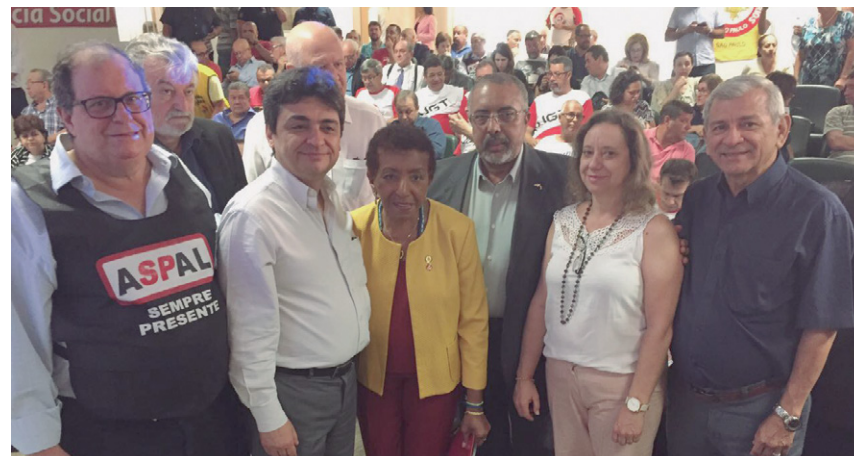
Afalesp e Aspal em reunião da CPI da Previdência

O parecer aprovado prevê regras diferentes de acordo com a data de entrada no serviço público. Quem entrou depois da criação dos fundos de previdência complementar, em 2012, vai seguir as regras dos trabalhadores do setor privado para o cálculo da aposentadoria: 70% da média das contribuições desde 1994,