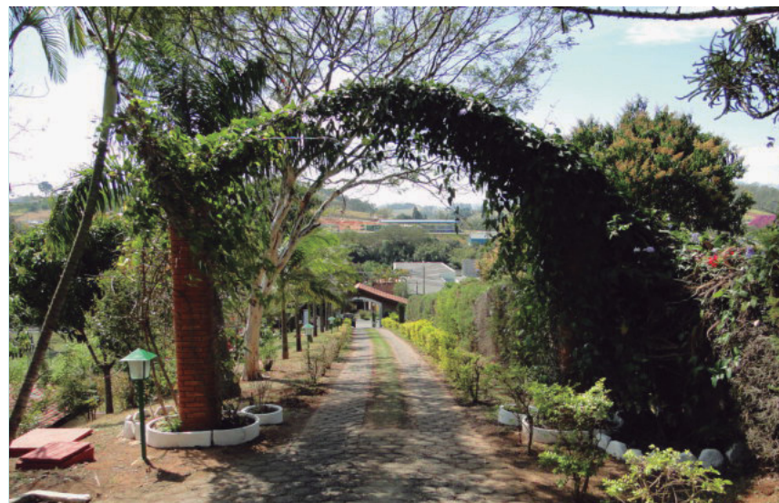
Socorro, muito arborizada