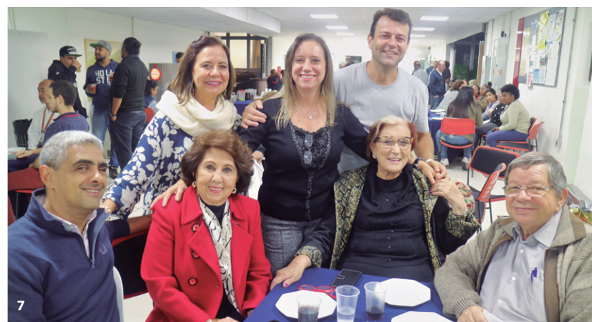
1 e 2 Passeio a Jaguariúna - 3 e 4 Visita à Pinacoteca - 5, 6 e 7 Festa do Dia das Mães