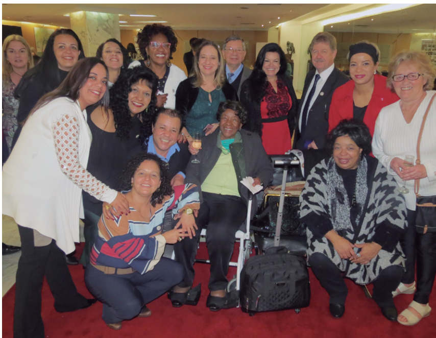
Funcionários da Afalesp e convidados