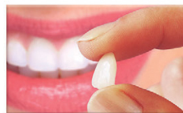
Lentes de contato dentais