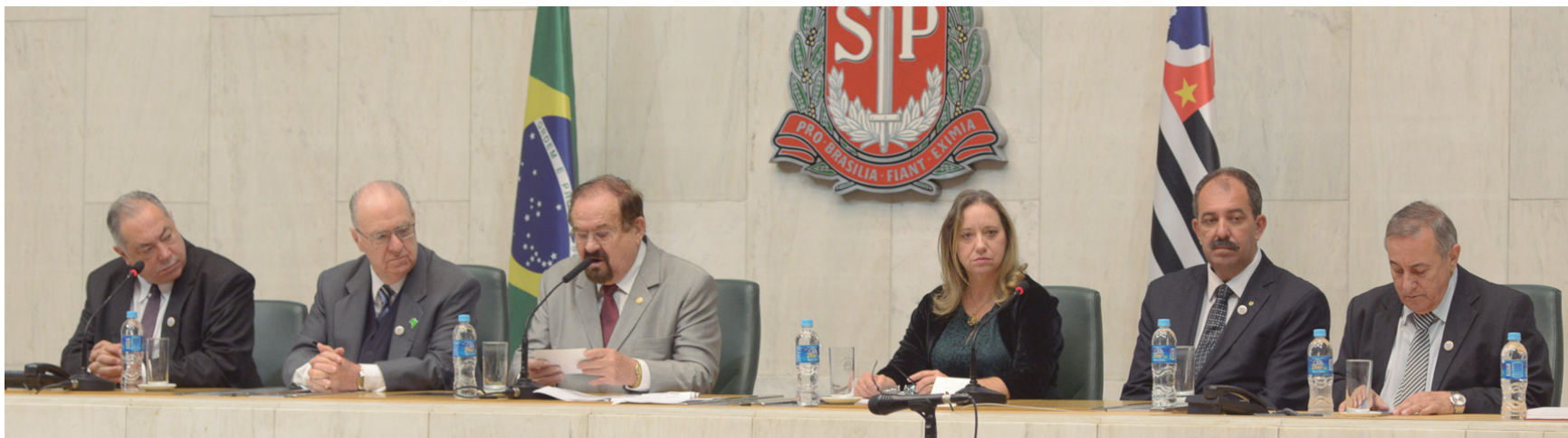
Mesa dos trabalhos da sessão solene

No dia 9 de julho deste ano, a Afalesp completou 70 anos de fundação. Para comemorar essa data tão importante, a Assembleia realizou, no dia 4 de agosto, uma sessão solene no plenário Juscelino Kubitschek, presidida pelo deputado Aldo Demarchi.