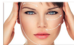
Preenchimento, Bichectomia e Botox