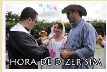
HORA DE DIZER SIM