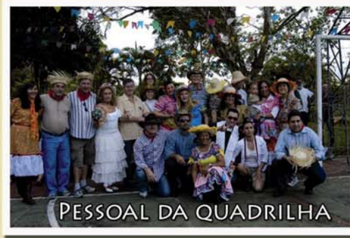
PESSOAL DA QUADRILHA