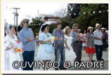
OUVINDO O PADRE