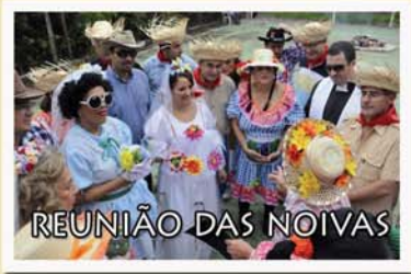
REUNIÃO DAS NOIVAS