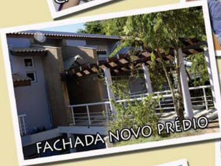
FACHADA NOVO PRÉDIO