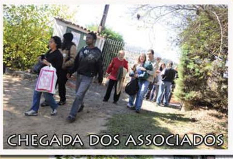
CHEGADA DOS ASSOCIADOS