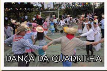
DANÇA DA QUADRILHA