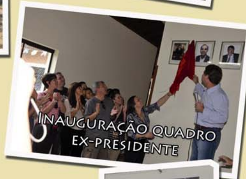
INAUGURAÇÃO QUADRO EX-PRESIDENTE