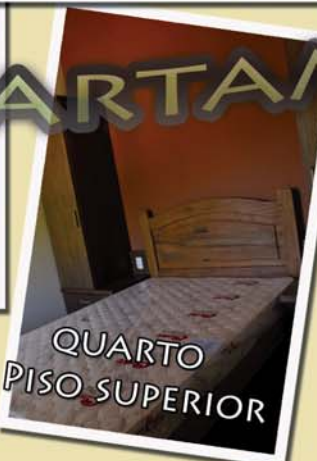
QUARTO PISO SUPERIOR