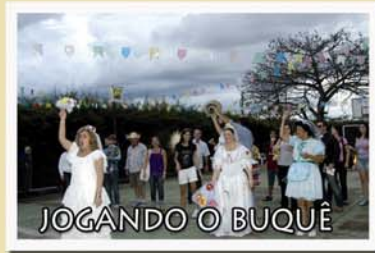
JOGANDO O BUQUÊ