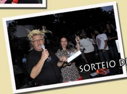
SORTEIO DE BRINDES