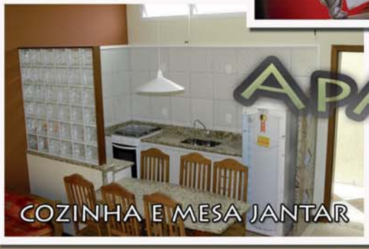
COZINHA E MESA JANTAR