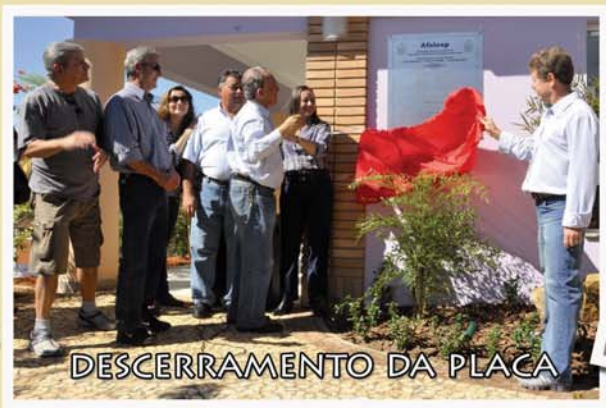
DESCERRAMENTO DA PLACA