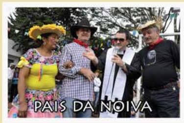
PAIS DA NOIVA