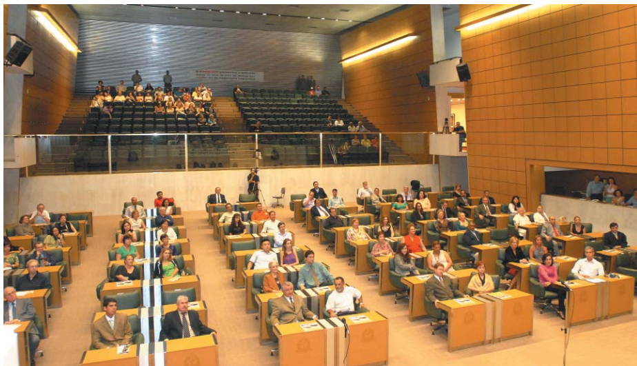
Foi realizada Sessão Solene no Plenário Juscelino Kubitschek de Oliveira...

Em 9 de julho, transcorreu o 60º aniversário de fundação da AFALESP, então Grêmio 9 de Julho. A data foi comemorada durante todo o ano, porém, em virtude da agenda da Casa, foi realizada Sessão Solene, também alusiva aos 60 anos de reabertura do Poder Legislativo, dia 29 de outubro.