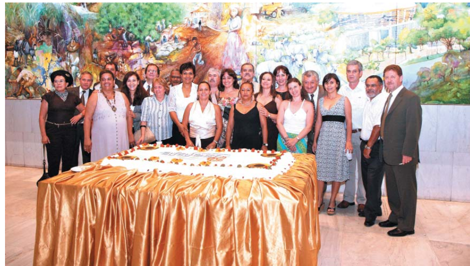
... seguida de coquetel e bolo de aniversário no Hall Monumental.

De lá para cá, o Legislativo sofreu com dois fechamentos, o mais duro durante o Estado Novo, quando foram cassados 24 deputados. "Foi criada uma comissão suprapartidária que conseguiu fazer a democracia triunfar", comentou o presidente, falando ainda da participação dos funcionários para que a Assembléia consiga servir ao povo paulista da melhor maneira possível.