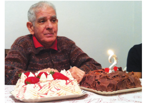
Assembleia foi diretor da Divisão Técnica de Taquigrafia durante dez anos.

Falecido em 18 de abril último, Etelvino já está fazendo muita falta nesta Casa há um bom tempo em virtude de enfermidade. Ele foi diretor da AFALESP durante diversas gestões, a última delas na gestão do Augusto Carlos, e na