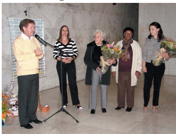
Diretoria da AFALESP presta homenagem às mães

Com animação musical de Carlos Ayala, a Festa do Dia das Mães, realizada dia 10 de maio, foi das mais participativas, principalmente porque fez parte do calendário de festividades do 60º aniversário da AFALESP.