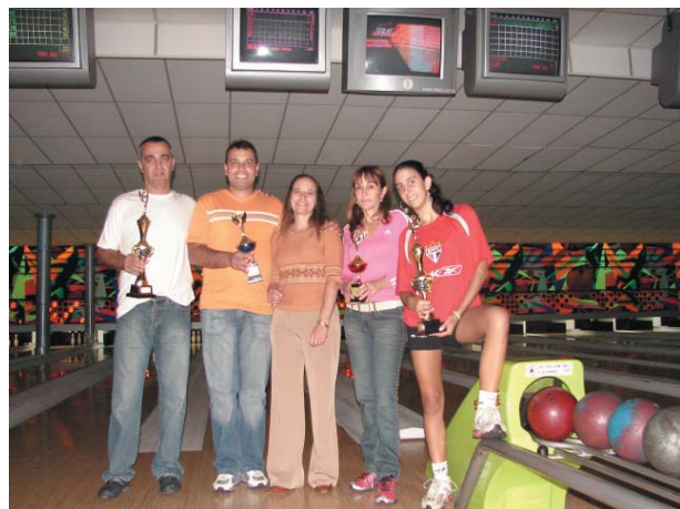
Os vencedores do Festival com a presidente da AFALESP

Mais de 80 pessoas participaram do I Festival de Boliche da AFALESP, realizado dentro das programações do 60º aniversário da Entidade, realizado no Boliche Strike, no Sacomã, dia 14 de maio.