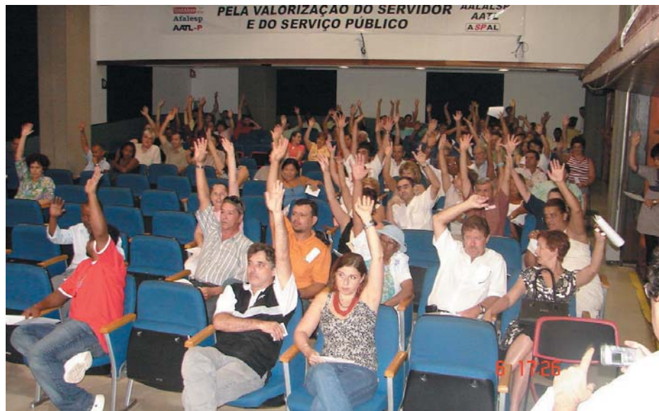
As Assembléias Gerais tiveram grande participação dos servidores

O Diário Oficial de 16 de junho de 2007 publicou a Lei Complementar nº 1011, que “concede reajuste aos servidores da Assembléia Legislativa do Estado de São Paulo e dá outras providências”.