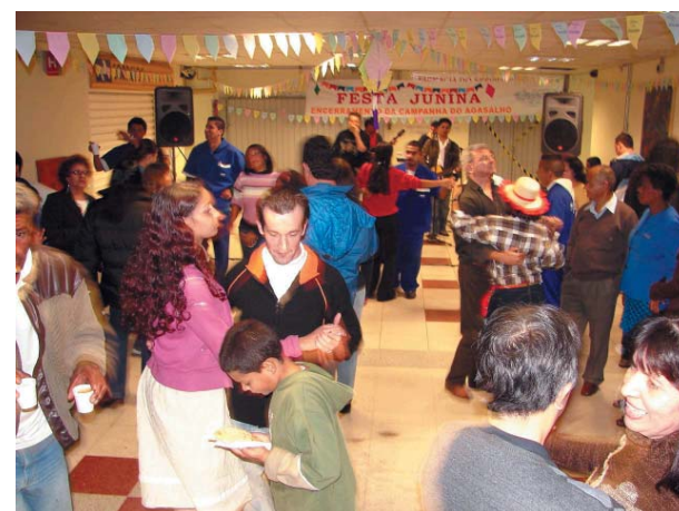
Muita animação na festa junina

Dia 25 de junho, uma segunda-feira, foi realizada a tradicional Festa Junina da AFALESP, no jardim interno do sub-solo do Palácio 9 de Julho.