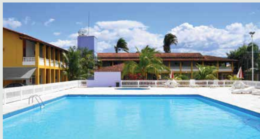
Piscina de Caraguá

É a Afalesp trabalhando pela qualidade de vida do associado!