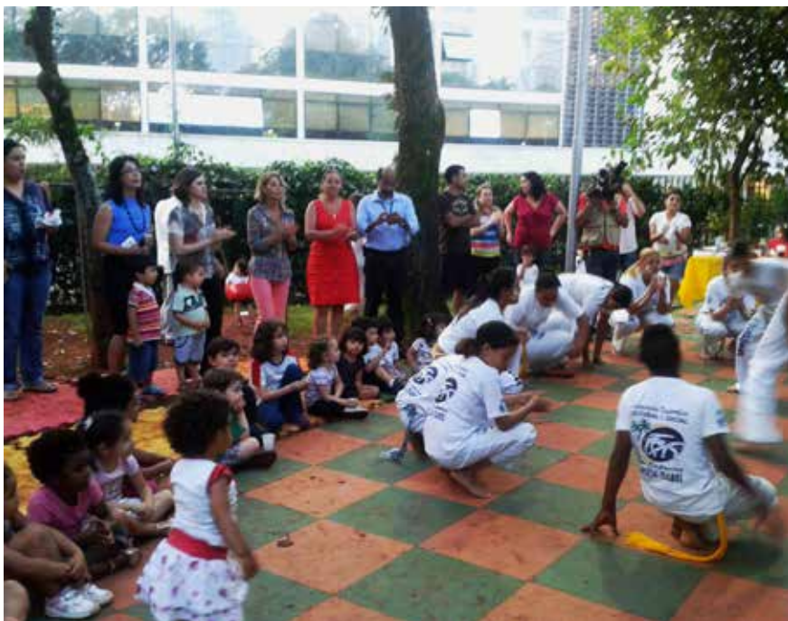
Crianças aprendem a jogar capoeira