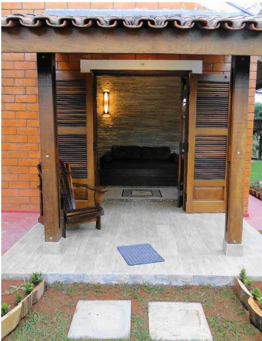
Material de qualidade usado nas obras garante beleza e conforto para os sócios

Unidades receberam mesmo tratamento que o Chalé 14