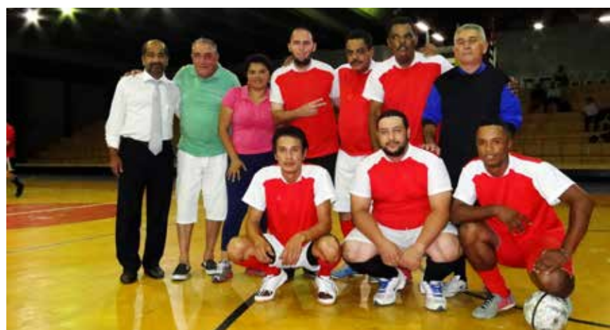
Equipe campeã masculina