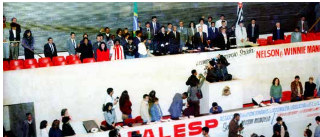
Plenário JK em 2 de agosto de 1991. Faixa exhibe os dizeres: "Afalesp saúda Nelson Mandela"

A Afalesp une-se às homenagens à sua memória.