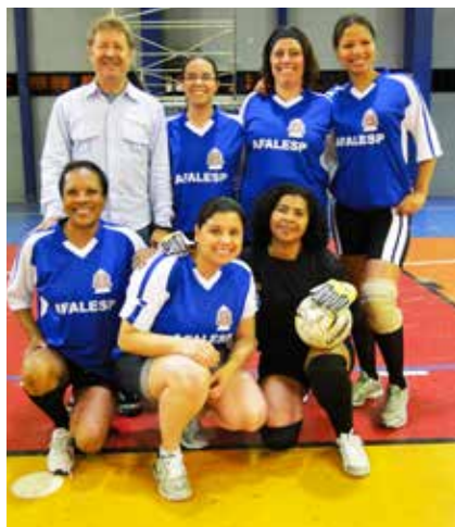
Equipe campeã feminina