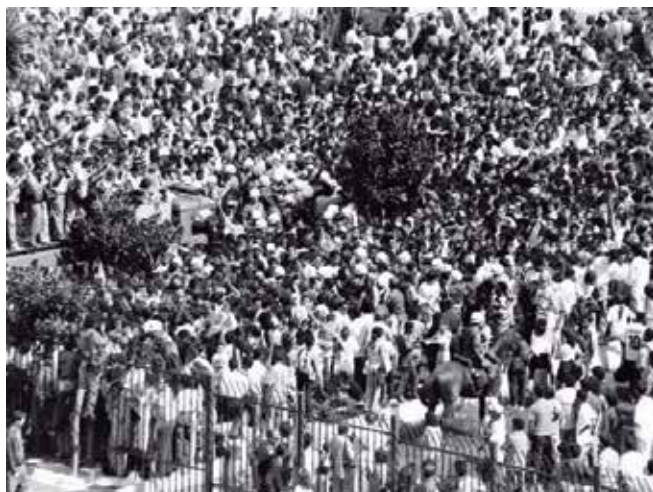
Fãs se aglomeram no estacionamento no velório de Senna

Maurício destaca a importância do trabalho fotográfico, “que muitas vezes passa despercebido”. Ele enfatiza o valor documental e histórico da produção fotográfica. “São imagens que vão ficar inscritas na história do país”, reforça.