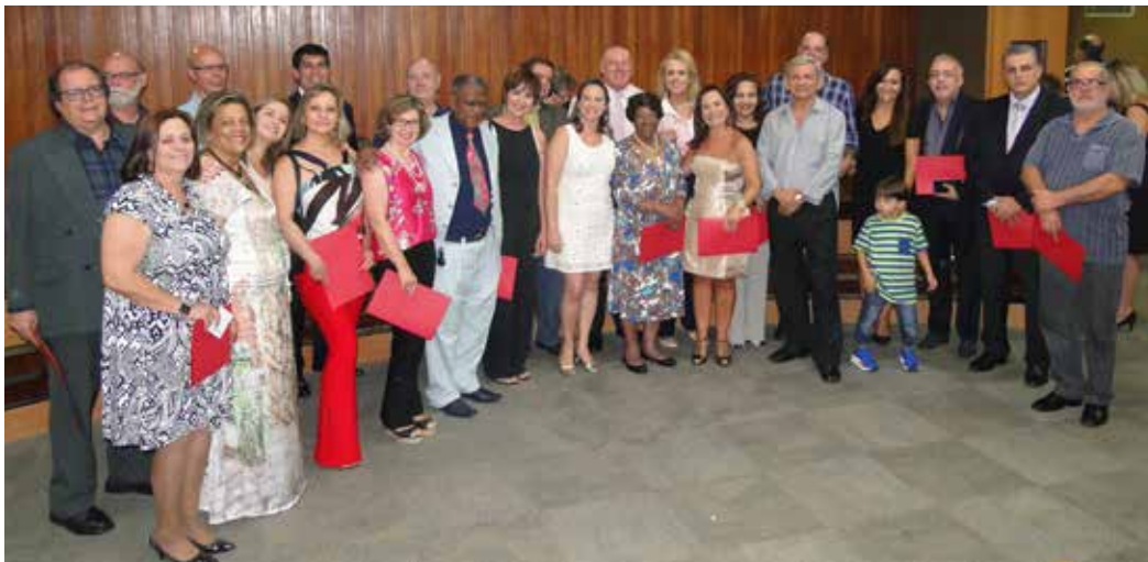
Eleitos, após a posse, no auditório Teotônio Vilela